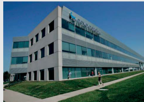
Denmark, Novo Nordisk