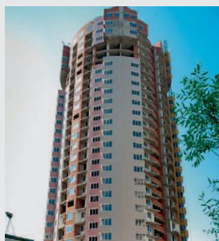
Russia, Park Tower Khimi