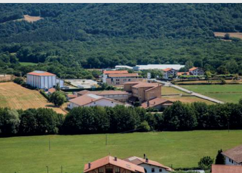
Spain, Ultrama Campus