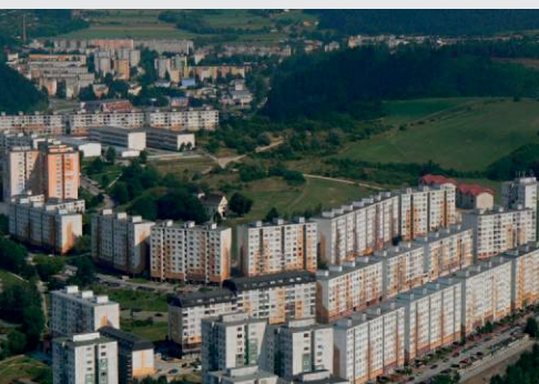
Slovakia, Povážská Bystrica