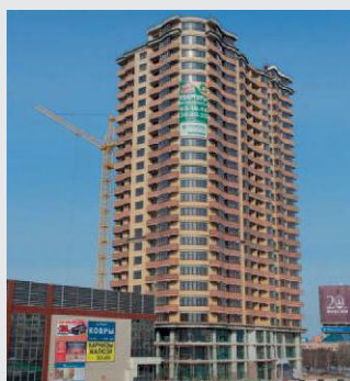
Russia, Parus Tumen