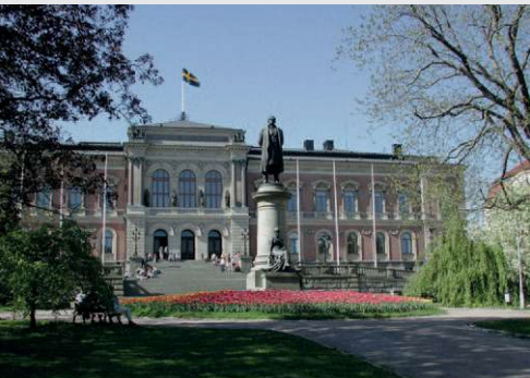
Sweden, Uppsala Universitat