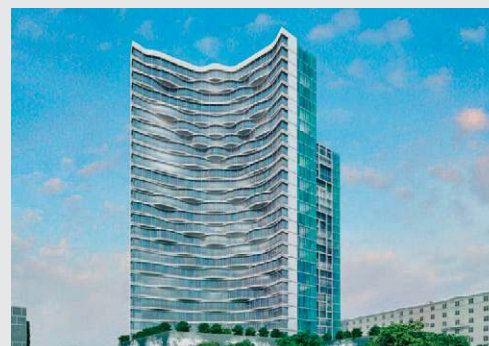
Russia, Zorge (Kazan)