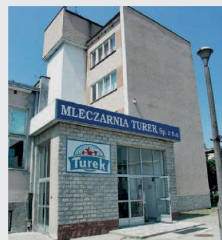
Poland, Turek Dairy